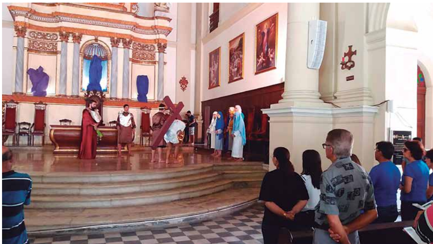
Fiéis observam a apresentação das 15 fases das estações da via-sacra na catedral, que relembrou em primeiro plano a prisão de Jesus Cristo

Ao meio-dia, houve o Ofício da Agonia do Senhor, que é o conjunto de cânticos, orações, salmos e leituras bíblicas sobre as lamentações de Jesus, pelos que não acolheram a sua mensagem e exemplo na terra. Em frente ao altar, velas representavam as letras do alfabeto, de A a Z, simbolizando a universalidade do Cristo e seus ensinamentos. As velas foram sendo apagadas durante a celebração e as imagens na igreja estavam cobertas, em sinal