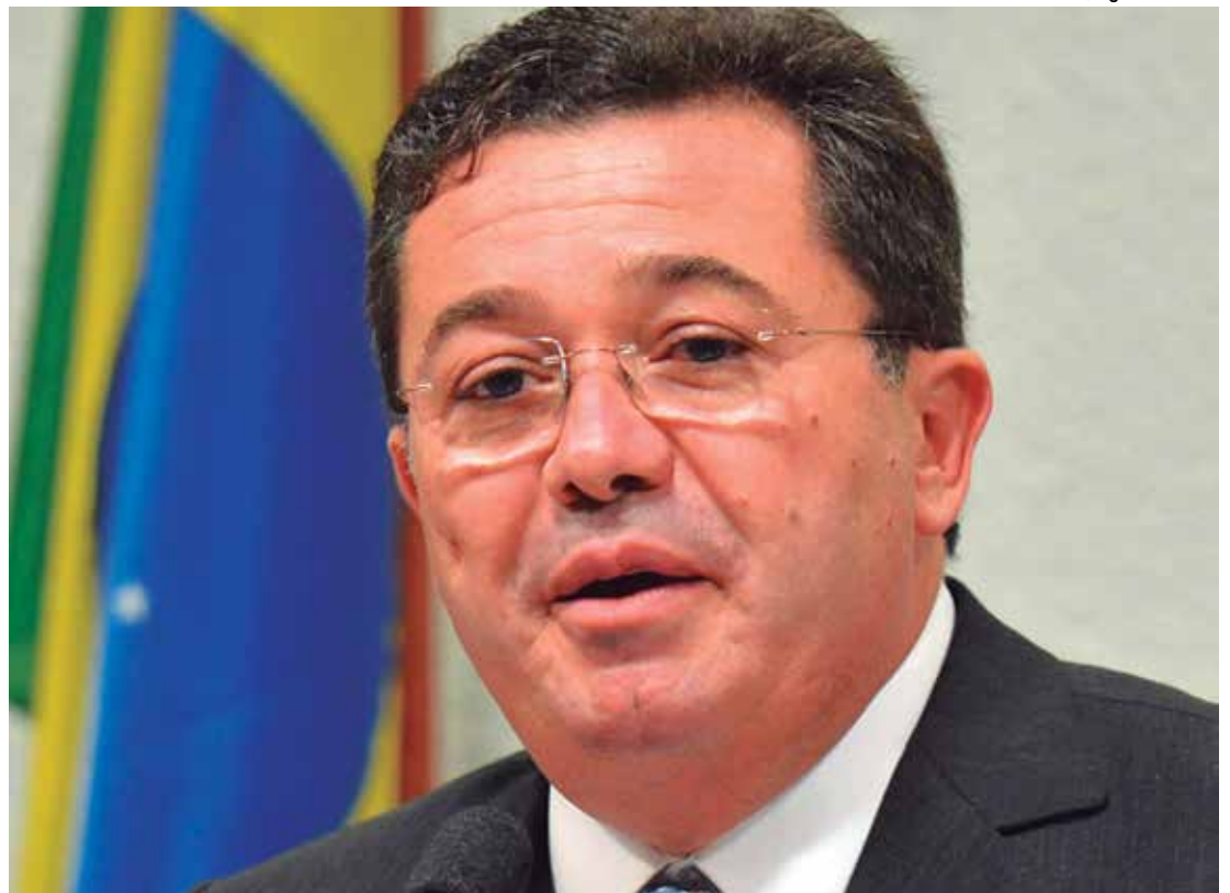
Em 2015, o atual integrante da Corte do Tribunal de Contas da União, Vital do Rêgo, havia sido denunciado