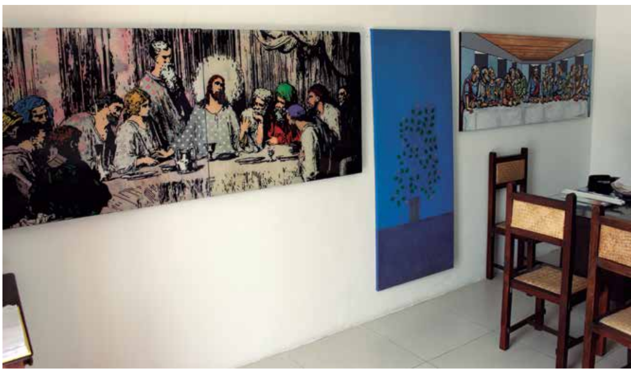
A exposição temática intitulada Frutos da Paixão, que reúne pinturas, desenhos e fotografias de 26 artistas plásticos paraibanos, é uma boa opção cultural para os turistas e moradores da capital de todas as idades